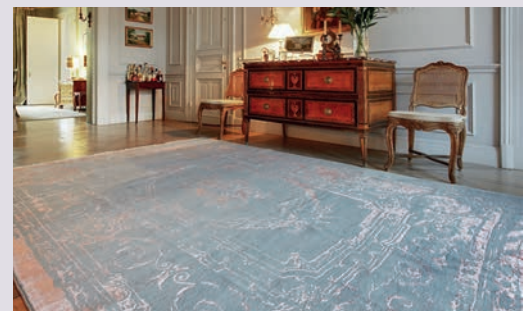
Individuell: Jeder Teppich wird passend auf den Raum zugeschnitten.

Negra AG, Negra Carpet&Home, Im Handelshof, Uraniastrasse 33, 8001 Zürich, T 044 210 12 00, www.negra.ch