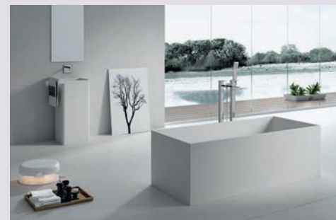
Klare Formsprache: Diese Variante bietet sich auch als Wand- oder Ecklösung an sowie in kleineren Räumen.