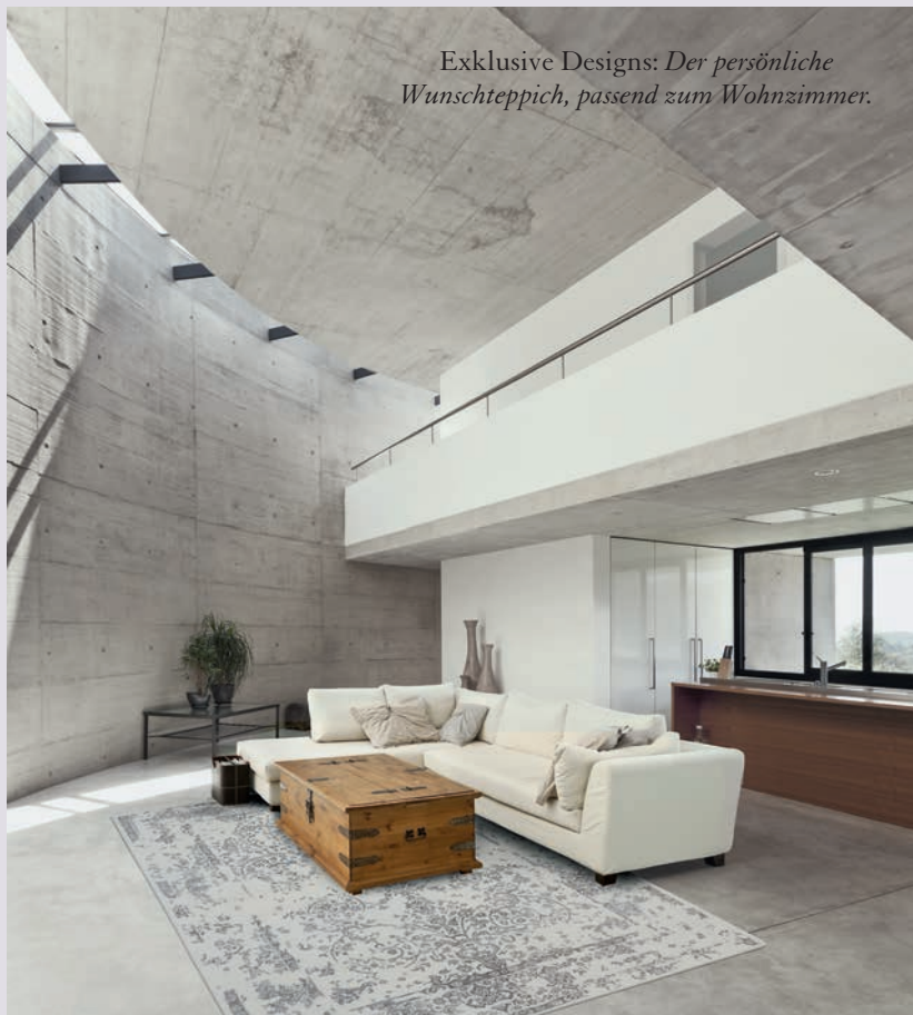
Exklusive Designs: Der persönliche Wunschteppich, passend zum Wohnzimmer.