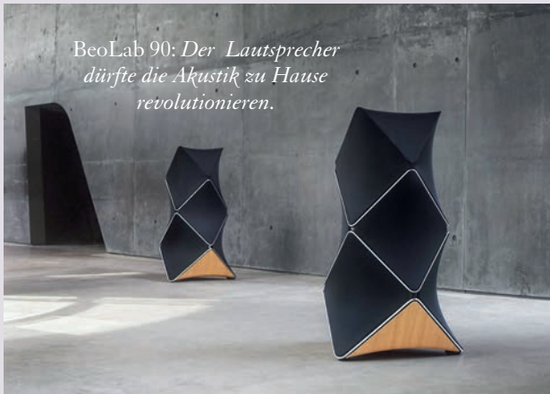
BeoLab 90: Der Lautsprecher dürfte die Akustik zu Hause revolutionieren.

Raffiniert und individuell gestaltete Einzelstücke geben auch einem alten Raum einen neuen Charakter. Lassen Sie sich von den neusten Kreationen inspirieren und holen Sie sich neue Ideen für ein einzigartiges Wohnambiente.