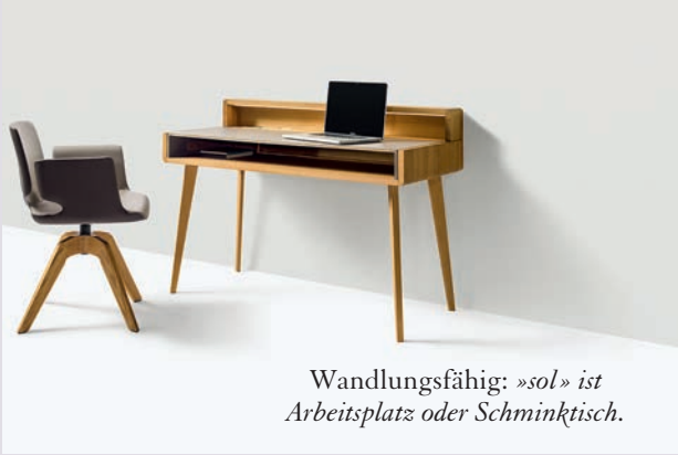
Wandlungsfähig: »sol« ist Arbeitsplatz oder Schminktisch.

Gleich zwei Entwürfe von Designer Sebastian Desch – der Barhocker «ark» und das charakterstarke Einzelmöbel «sol» wurden mit dem Label Iconic Awards 2016: Interior Innovation – Winner prämiert. «sol» fungiert als Home-Office-Arbeitsplatz, Dielen-Konsole oder eleganter Frisiertisch. Ein wandlungsfähiges Einzelmöbel erweitert damit die Produktpalette des österreichischen Naturholzspezialisten. Ob wandhängend, von zwei Beinen gestützt oder freistehend im Raum: «sol» ist ein wahres Multitalent, in jedem Wohnbereich zu Hause und dabei herrlich klar im Design. Im Inneren der Schalen finden smarte Zusatzfunktionen wie eine Steckdose mit USB-Anschluss, die innovative Ladefunktion Qi, eine Stifteschale, Utensilienboxen oder ein Geheimfach ihren Platz.