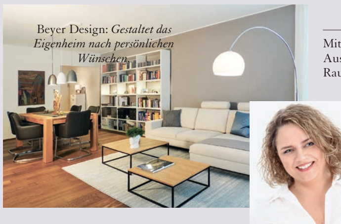
Beyer Design: Gestaltet das Eigenheim nach persönlichen Wünschen.