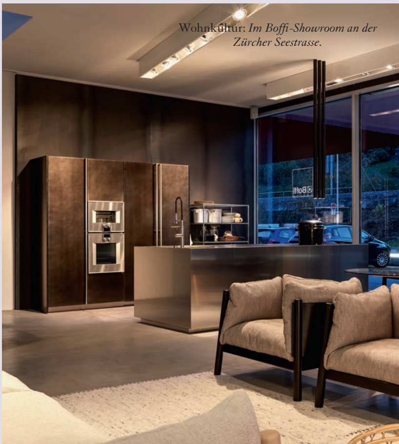
Wohnkultur: Im Boffi-Showroom an der Zürcher Seestrasse.