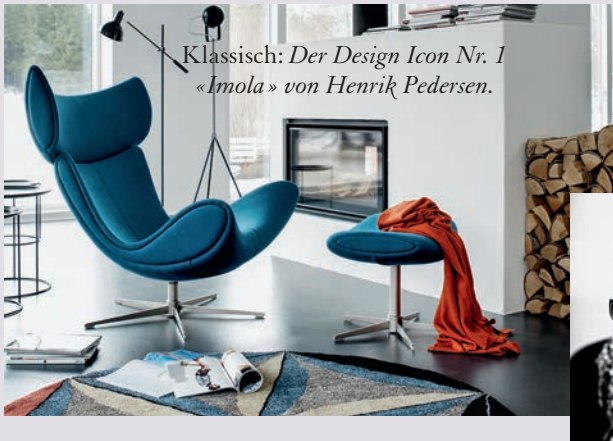
Klassisch: Der Design Icon Nr. 1 «Imola» von Henrik Pedersen.