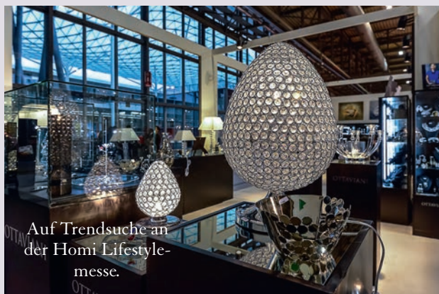
Auf Trendsuche an der Homi Lifestyle-messe.

Beyer Design, Kreuzboden 21, 6344 Meierskapell T 044 790 11 11, www.beyerdessign.ch